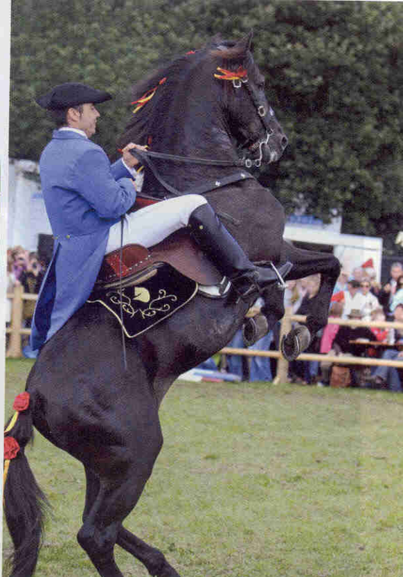
Ook onder het zadel konden de oefeningen getoond worden