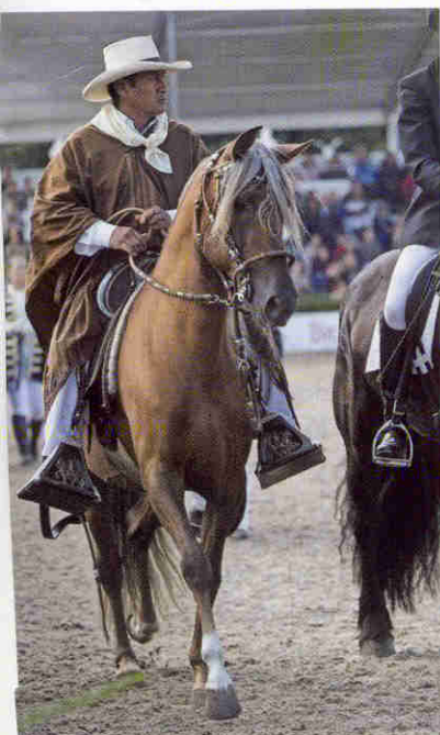
De Paso Peruano hengst vond het wel erg spannend in de ring