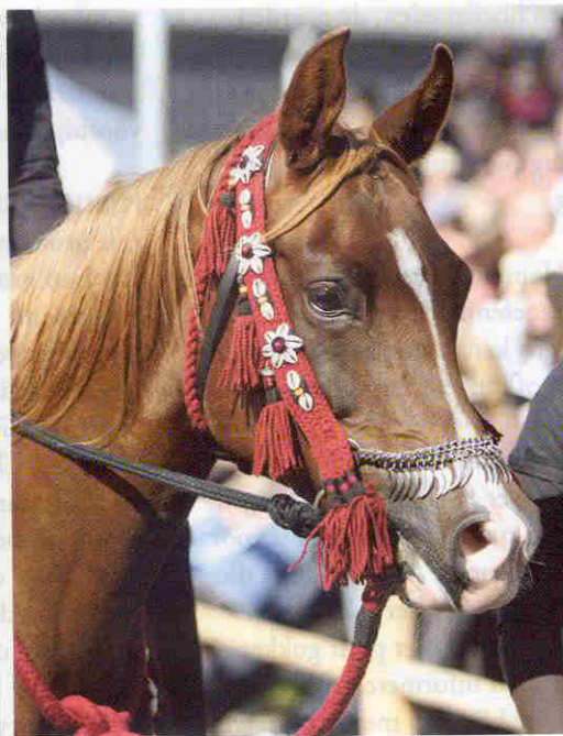
Uiteraard mocht de Arabier niet ontbreken in het rassendefilé