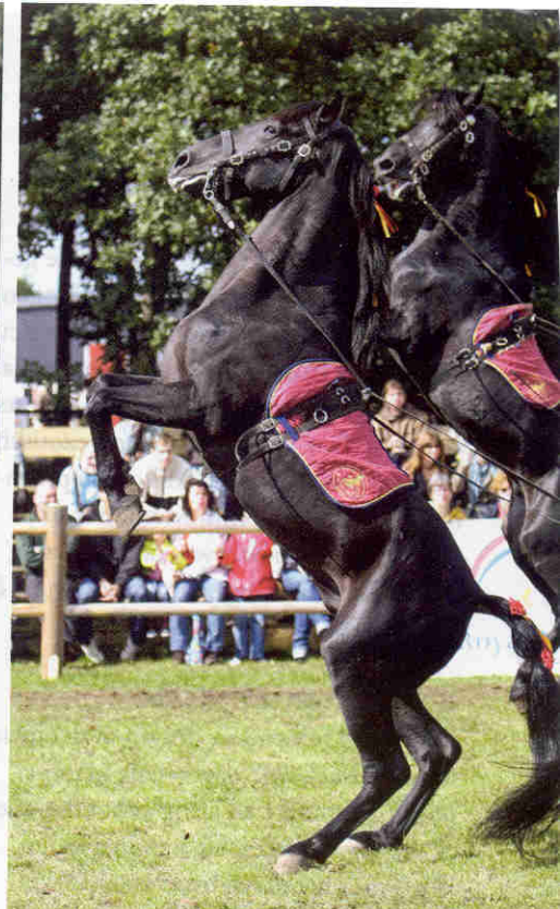
Het steigeren gaat perfect gelijk en werd vroeger ook op het slagveld gebruikt om de tegenstander te verslaan