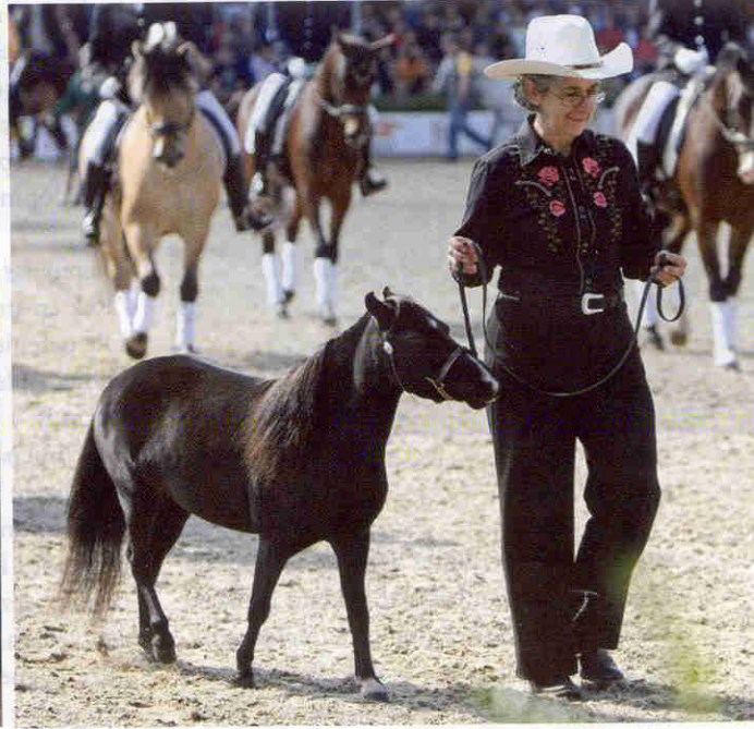
Ook de allerkleinste American Miniature Horse deed mee in het defilé