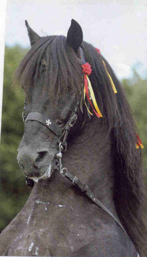
Pura Raza Menorquina, de zwarte parel uit Menorca Spanje