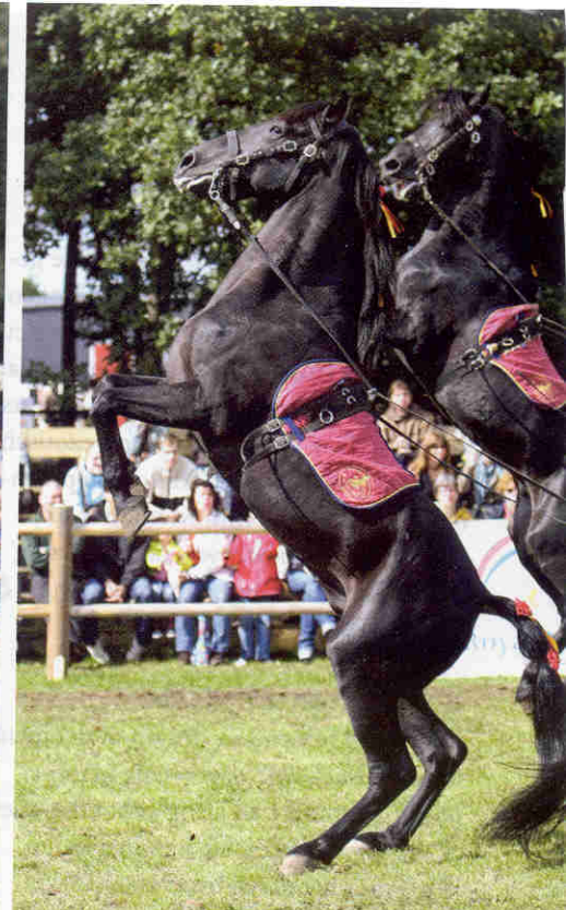
Het steigeren gaat perfect gelijk en werd vroeger ook op het slagveld gebruikt om de tegenstander te verslaan